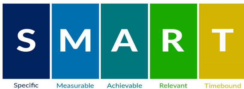
Фигура 2. Акроним SMART

Целите „SMART“, описани в глава 3, могат също да бъдат използвани за разработване на рамка за оценка на процеса на участие чрез отговор на всяка буква от съкращението, както е показано на фигурата по-долу (фигура 2).