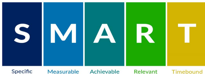
Slika 2. Kratica SMART

Cilji “SMART”, ki so opisani v 3. poglavju, se lahko uporabljajo za razvoj evalvacijskega okvirja participatornega postopka z odzivanjem na vsako črko kratice, kot je prikazano spodaj (Slika 2).